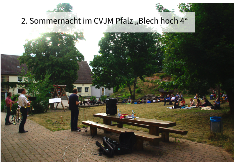
2. Sommernacht im CVJM Pfalz „Blech hoch 4“

Dafür ein herzliches: DANKE SCHÖN! (r.rosenthal)